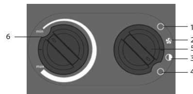
Рис. 2. Блок управления