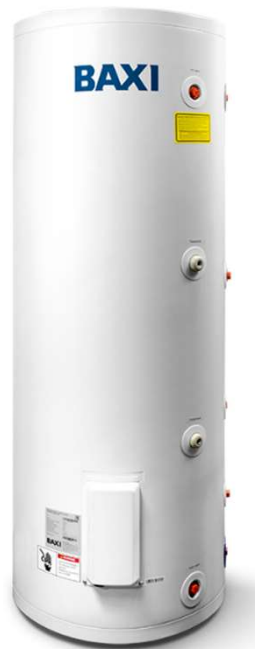
UBC 100/200/250 /300/400/500