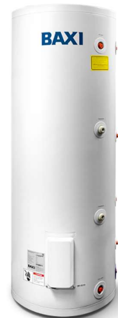
UBC DC 200/300/400/500