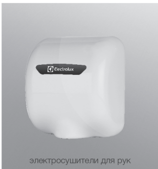
электросушители для рук