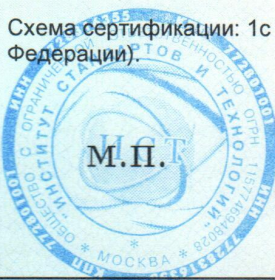
Схема сертификации: 1с (ГОСТ Р 53603-2020 Оценка соответствия. Схемы сертификации продукции в Российской Федерации).